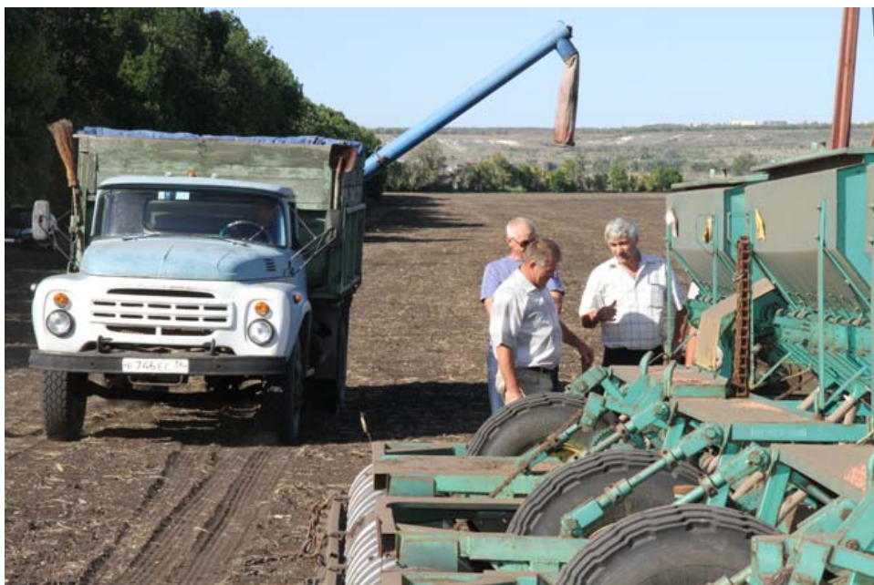
Оказывается, новые модели техники не всегда лучше старой. Земледельцы из «Истоков» убедились в этом на своем опыте.

ние, чтобы поставить производство на научно обоснованные рельсы. Понятно, что речь шла о засилье подсолнечника, культуры экономически привлекательной, но значительно истощающей почву.