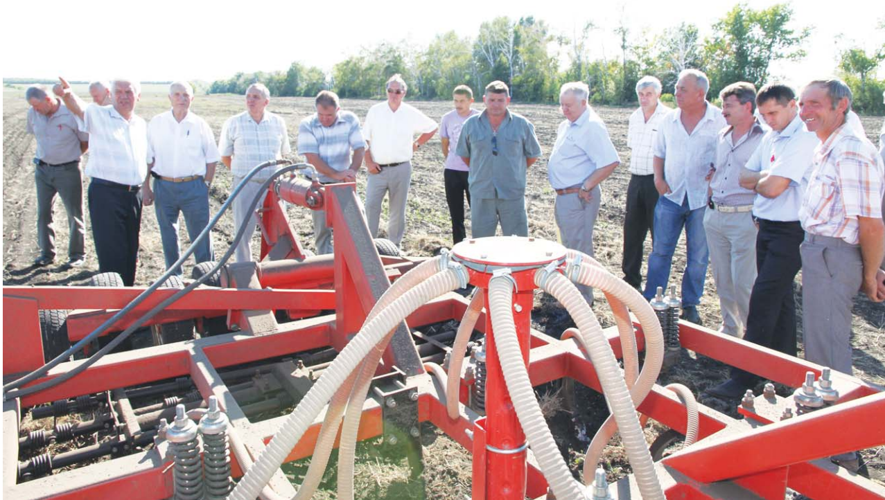
Участники семинара слушали друг друга с большой заинтересованностью.

А ТАКЖЕ ПОДСОЛНЕЧНИК, ЛЕН, НУТ И СТРАХОВОЕ ВОЗМЕЩЕНИЕ. О НИХ ГОВОРИЛИ НА НЕДАВНО ПРОШЕДШЕМ В РАЙОНЕ СЕМИНАРЕ- СОВЕЩАНИИ АГРАРИЕВ