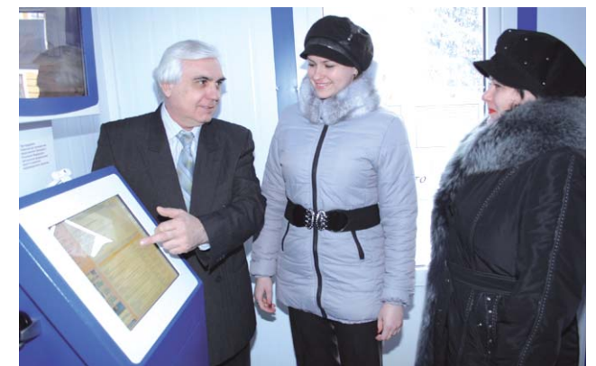
Каждому посетителю — максимум внимания.