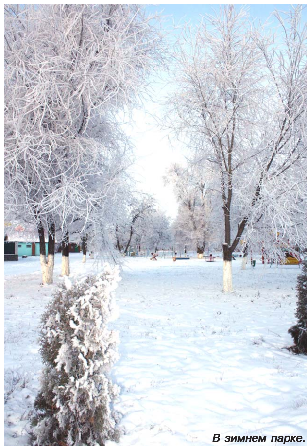
В зимнем парке.